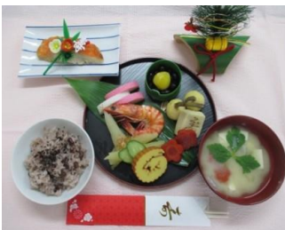
〈1月〉正月・おせち料理

グループホームを使用したデイサービスなので、季節に合わせた歳時記や行事など、入居者様と一緒にその時々に応じた催しや食事を楽しみます。