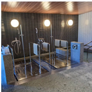
車いすのまま 浸かれる浴槽