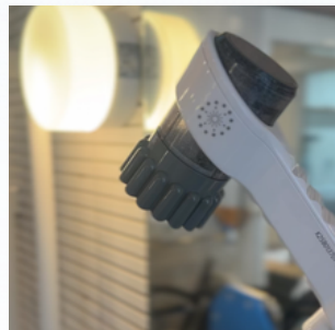
ミラブルゼロの シャワーヘッド