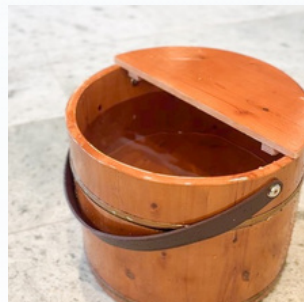
冷えやすい足先を 温める足湯