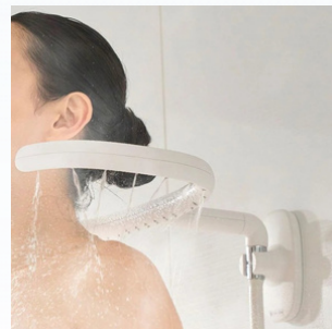
肩から全身を温める 肩シャワー