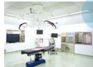
手術室(3室) (バイオクリーンルーム)