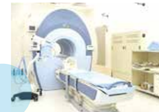
マルチスライスCT 撮影装置(16列)