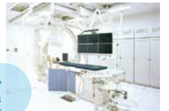
バイブレーション 血管撮影治療装置