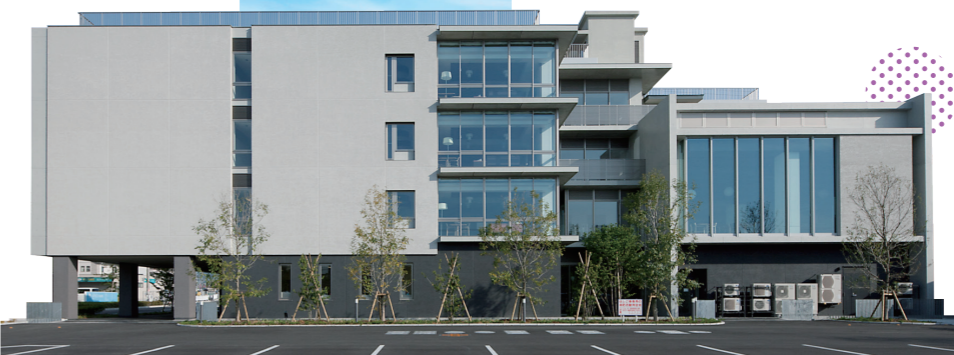
佐野記念病院・栄公苑